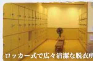
ロッカー式で広々清潔な脱衣所