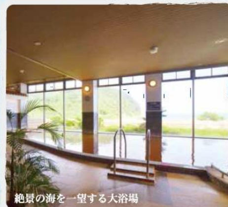
絶景の海を一望する大浴場