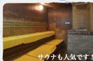
サウナも人気です!

TEL: 095-893-1133 FAX: 095-893-1135 info@nomozaki.or.jp