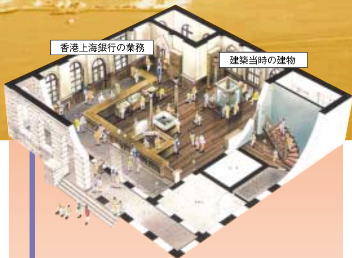
香港上海銀行の業務