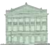
国指定重要文化財 旧香港上海銀行長崎支店

長崎駅前から1番系統正覚寺行きにのり、築町で5番系統石橋行きに乗り換えて、大浦天主堂下電停下車。